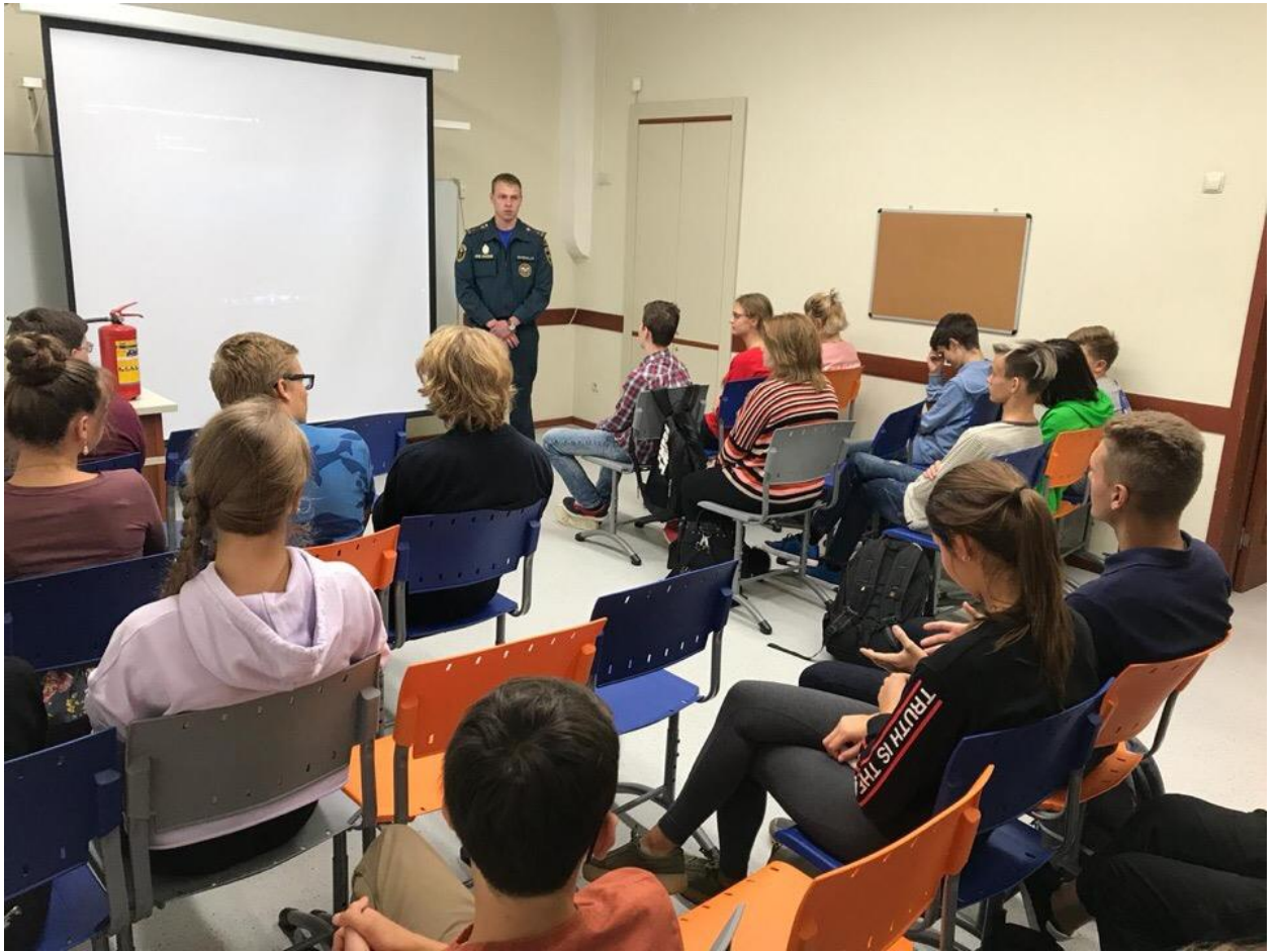
ОНДПР Центрального района ГУ МЧС России по Санкт-Петербургу 23.10.2018г.